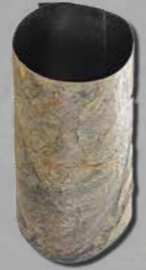
i fogli vengono consegnati arrotolati