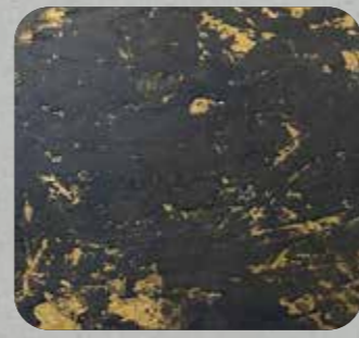
KUND BALCK GOLD