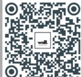
Guarda le realizzazioni